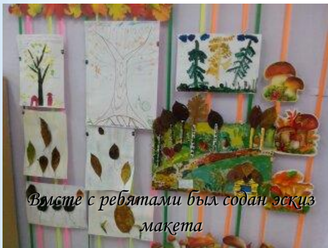
Вместе с ребятами был содан эскиз макета