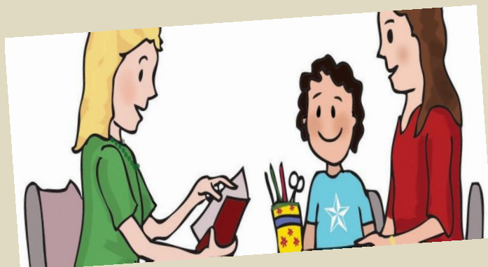
Диагностико - аналитическое