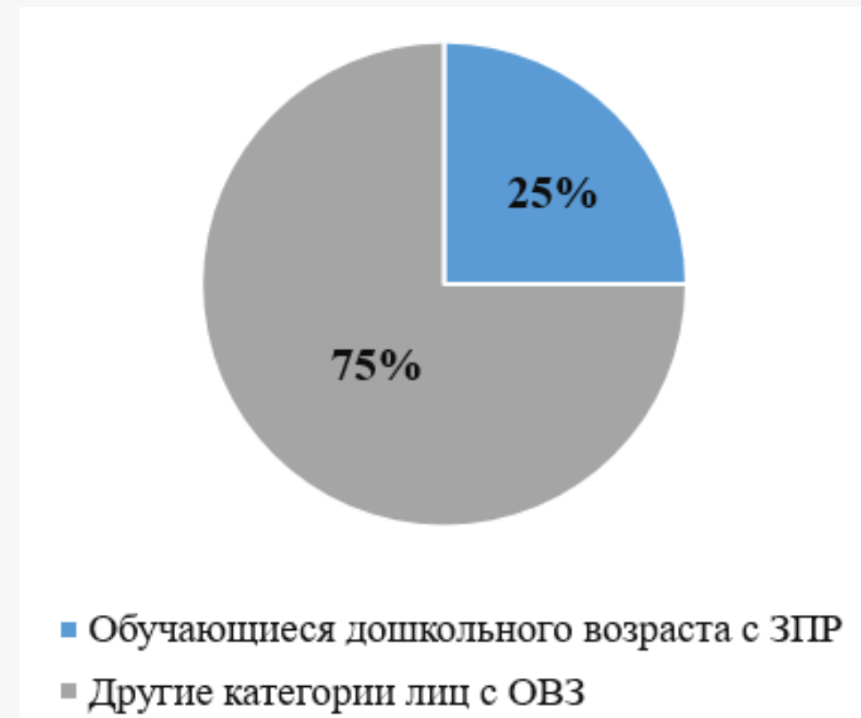
Рис. 1. Распространенность задержки психического развития (по данным О. А. Сергеевой и соавторов)

Цель – на основе результатов констатирующего исследования спланировать и реализовать логопедическую работу по коррекции лексико-грамматических нарушений в структуре преодоления СНР у старших дошкольников с ЗПР.