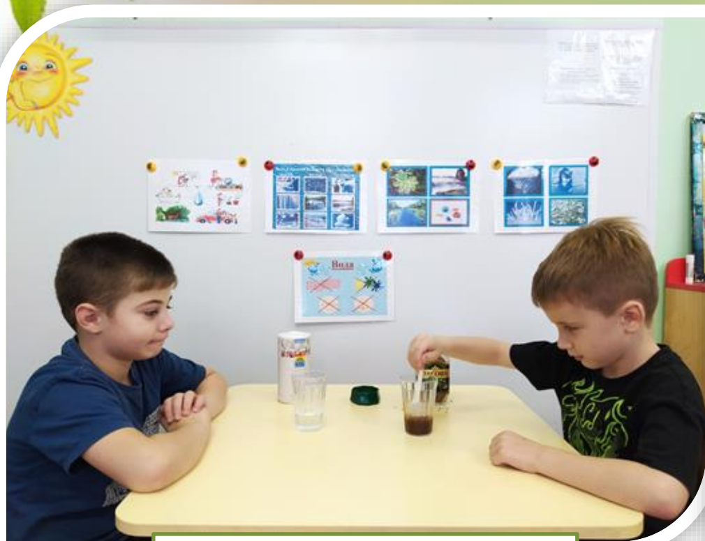
«Опыты с водой»