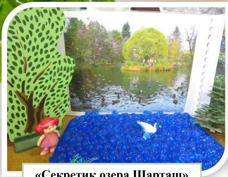
«Секретик озера Шарташ»