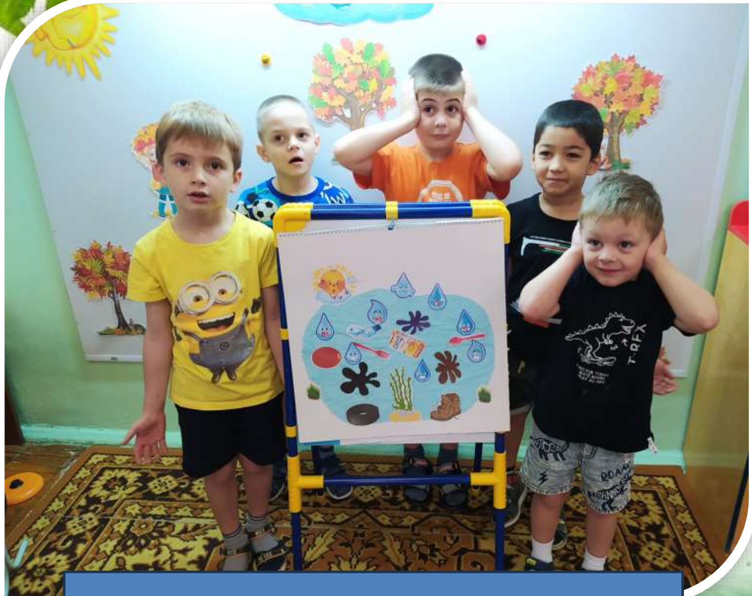
[A blue rectangular box containing text, likely a caption or title, is positioned at the bottom of the image. The text is not legible.]