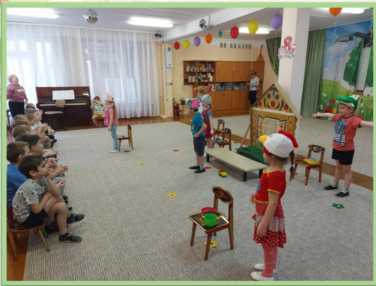
Работы ребят 11 группы после просмотра сказки