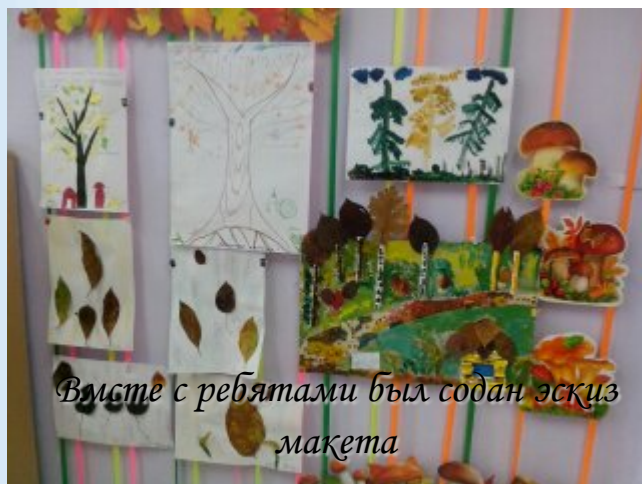
Вместе с ребятами был создан эскиз макета