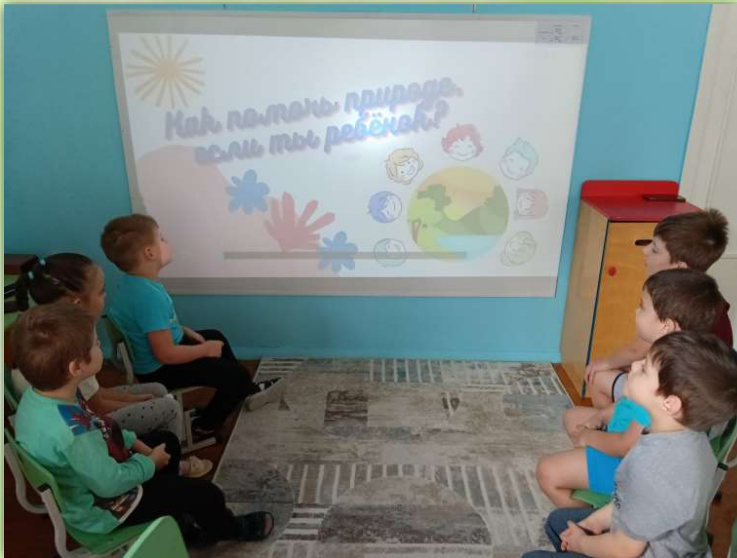
Просмотр видеофильма «Как помочь природе?»