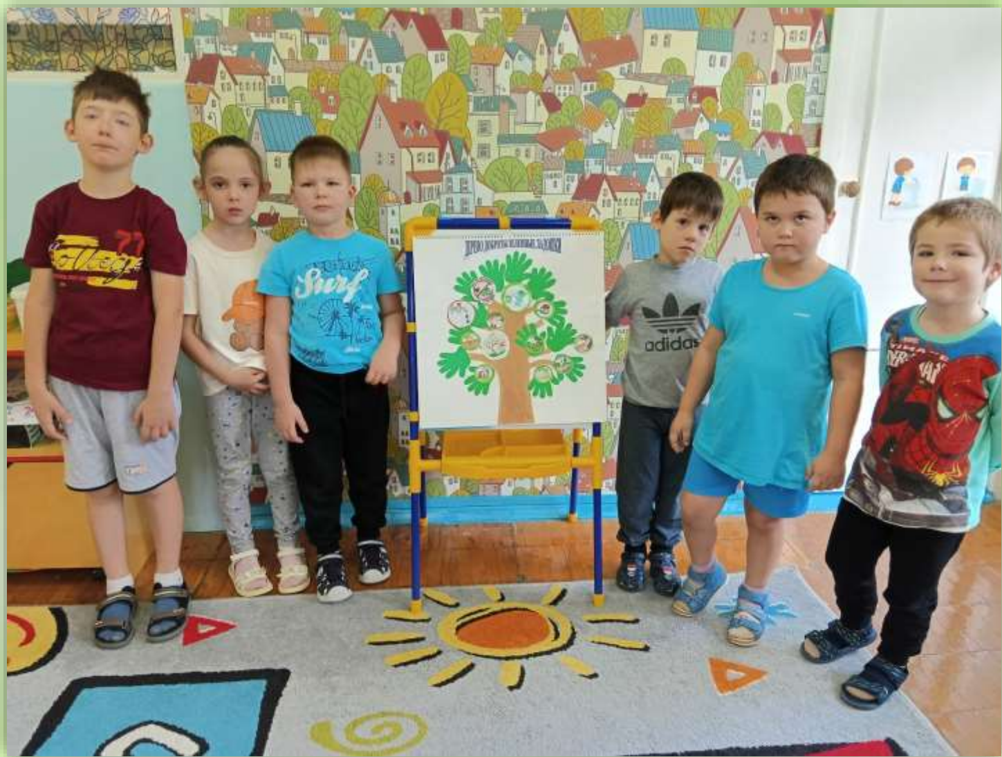
Заключительный этап «Дерево добрых дел»