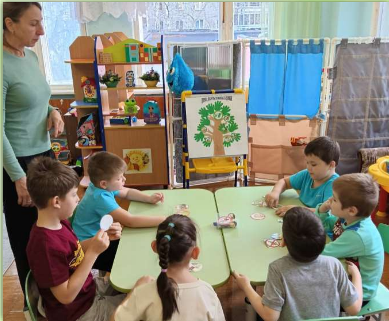
Беседа «Наши добрые дела»