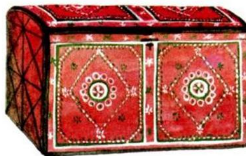
. ун дук