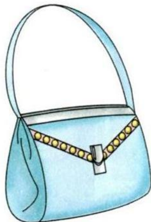
. ум ка