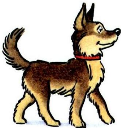
. оба ка